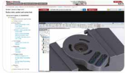
Mastercam® for SOLIDWORKS®